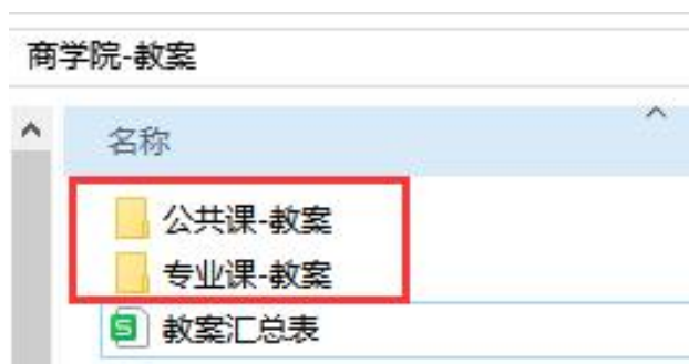
(图 2：二级文件夹命名)