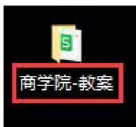
(图 1：一级文件夹命名)