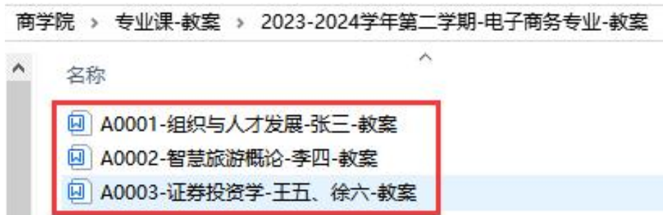
(图 5: 教案命名-专业课教案)