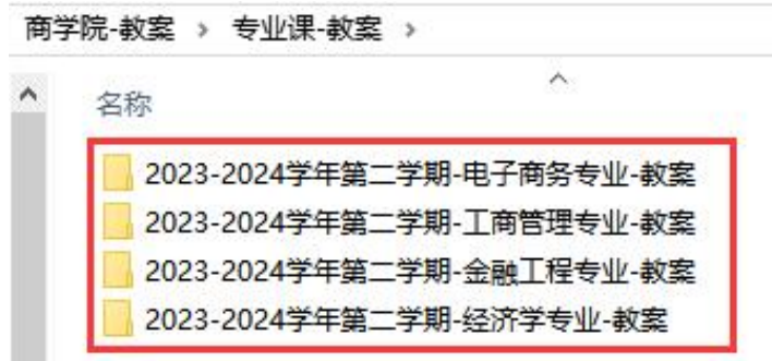
(图 3: 三级文件夹命名-专业课教案)